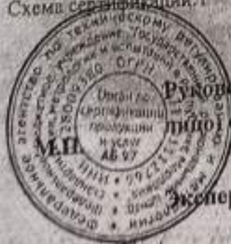
Схема сертификации: 1

Руководитель (уполномоченное лицо) органа по сертификации